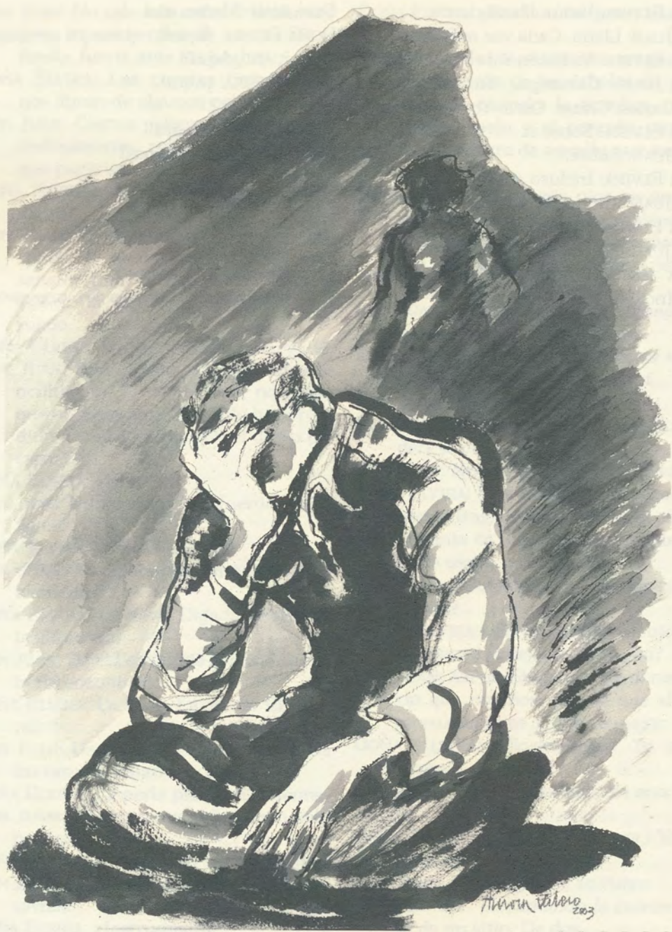
Aurora Valero, tinta china y gouche